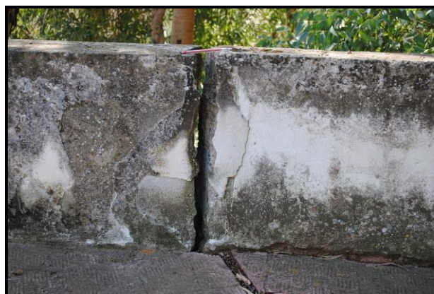
Foto n.15: frana di scorrimento (codice dissesto n. 072-2RS-113), in evidenza particolari dei quadri fessurativi ai manufatti (muretto) posti a tergo del locale distributore di carburante lungo la via Castelnuevo.