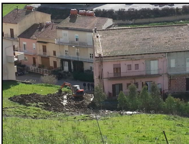
Foto nn.9 e 10: frana di scorrimento (codice dissesto n. 072-2RS-114); in evidenza particolari dei lavori di pronto intervento di rimozione del materiale terroso franato a tergo della pertinenza esterna nord e sul muro perimetrale est del fabbricato posto lungo la via Castelnuovo ai civici nn.170-172.