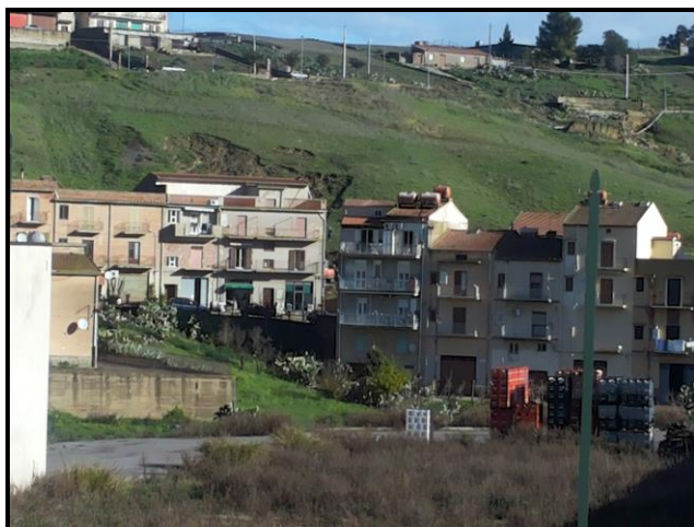
Foto n.7: frana di scorrimento (codice dissesto n. 072-2RS-114), panoramica areale con evidente individuazione della nicchia di distacco del materiale terroso franato a tergo dei fabbricati posti lungo la via Castelnuovo. (Foto fornita per gentile concessione dal Geol. D. Bonelli).