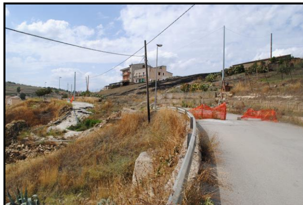
Foto nn.1 e 2: frana di scorrimento (codice dissesto n. 072-2RS-114), che ha traslato a valle un rilevante tratto del corpo stradale di via Colombo con annesse opere di contenimento.