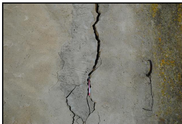
Foto n.16: frana di scorrimento (codice dissesto n. 072-2RS-113), in evidenza particolari dei quadri fessurativi al paramento murario esterno al fabbricato posto ad angolo tra la via Castelnuevo e la via Tegolai al civico n.29