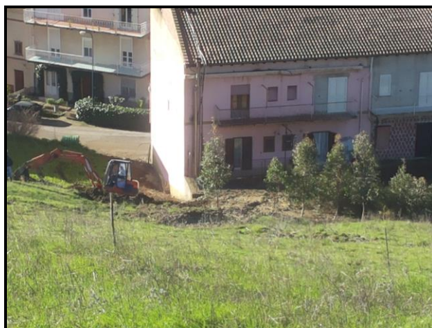
Foto n.8: frana di scorrimento (codice dissesto n. 072-2RS-114), particolare dei lavori di pronto intervento di rimozione del materiale terroso franato a tergo della pertinenza esterna al fabbricato ai civici nn.170-172 posti lungo la via Castelnuovo.