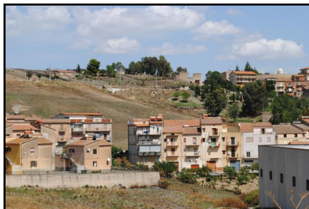
Foto nn.3 e 4: frana di scorrimento (codice dissesto n. 072-2RS-114); in evidenza le gabbionate in origine poste a contenimento del nord della carreggiata e traslate a valle dalla frana (foto n.3) e veduta panoramica dell'evento calamitoso a nord degli edifici lungo la via Castelnuovo (foto n.4).