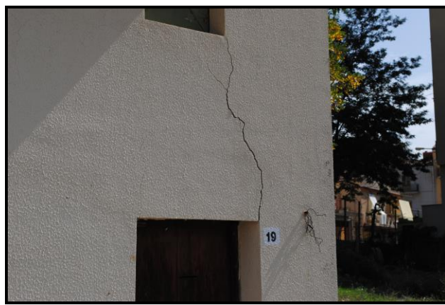
Foto nn.11 e 12: frana di scorrimento (codice dissesto n. 072-2RS-113); in evidenza particolari dei quadri fessurativi ai paramenti murari esterni dei fabbricati posti a valle della via Castelnuevo al civico n.133 e al civico n.19 di via Tegolai..