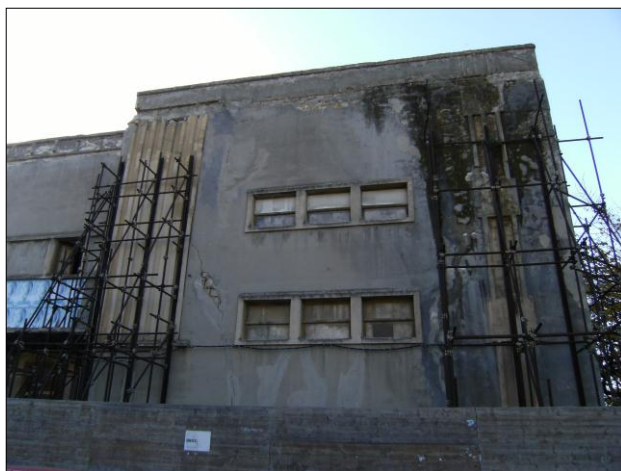
Foto n.16: Particolare del sito di attenzione 077-4PA-068 nell'area dell'edificio dell'ex cinema Ariston