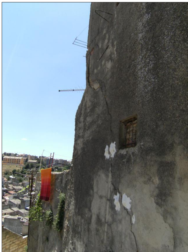
Foto n.8: Località Quartiere Itria (codice dissesto 077-4PA-051), fratture in fabbricato posto a valle di via Stradonello ed a monte della Chiesa dell'Itria.