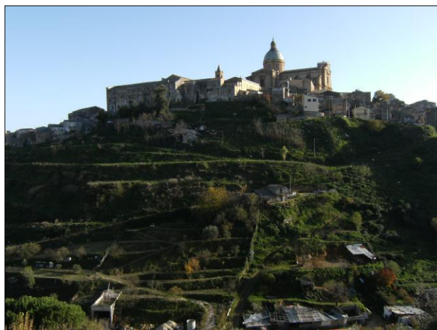
Foto n.17: Panoramica E-W di Costa San Francesco con porzione di versante privo di interventi di protezione antierosiva e consolidante (codice dissesto 077-4PA-062)