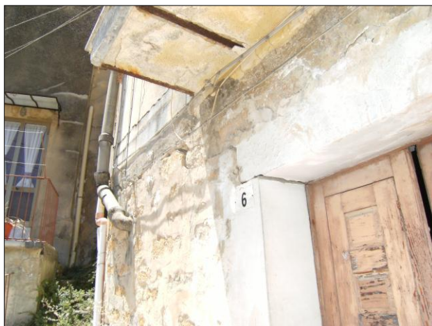
Foto n.10: Località Quartiere Itria (codice dissesto 077-4PA-051), particolare di fabbricato del Cortile Arena con fessure con rigetto centimetrico