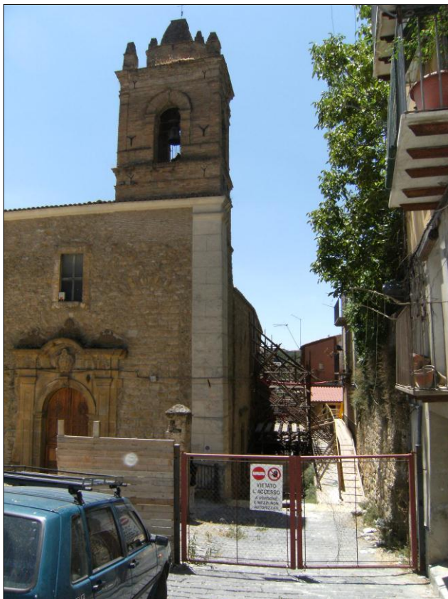
Foto n.01: Località Quartiere Itria (codice dissesto 077-4PA-051), Chiesa Santa Maria dell'Itria