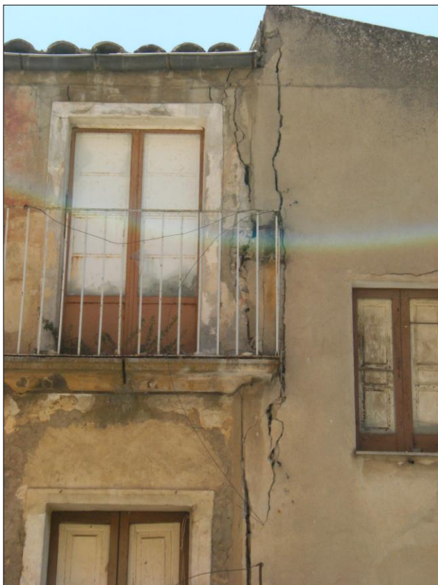
Foto n.5: Località Quartiere Itria (codice dissesto 077-4PA-051), particolare fratture in fabbricato di via A. Golino n.10