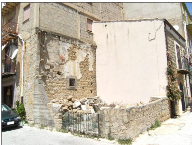
Foto n.9: Località Quartiere Itria (codice dissesto 077-4PA-051), fabbricato crollato anni 50'-60'