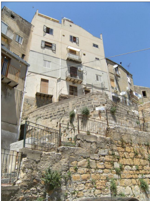
Foto n.7: Località Quartiere Itria (codice dissesto 077-4PA-051), esempio di fabbricazione in 4 piani e sopraelevazione su versante in terrazzamento antropico