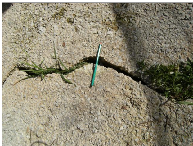
Foto n.14: Località Quartiere Itria (codice dissesto 077-4PA-051), particolare frattura beante interna allo spiazzo pertinenziale esterno edificio angolo via Licata.