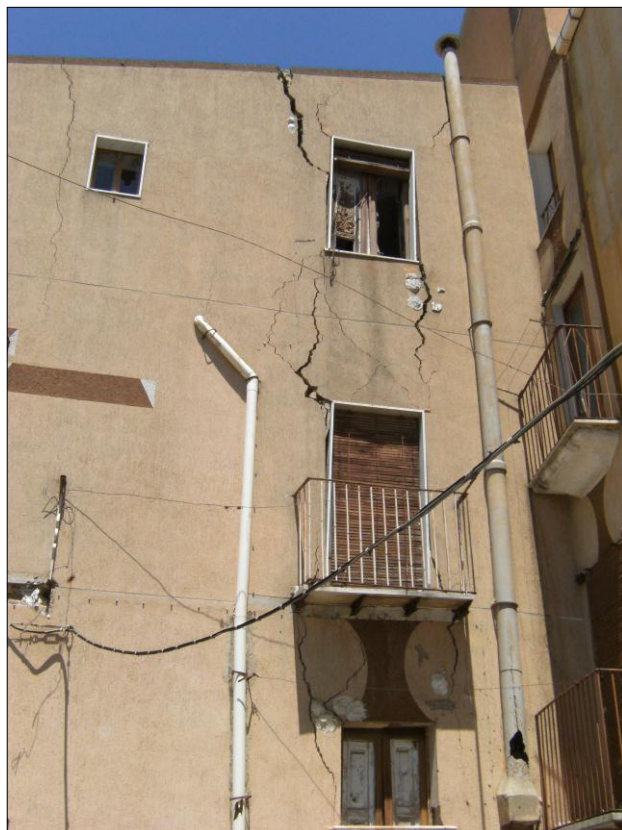
Foto n.6: Località Quartiere Itria (codice dissesto 077-4PA-051), particolare fratture in fabbricato di via A. Golino n. 6, angolo via Bologna