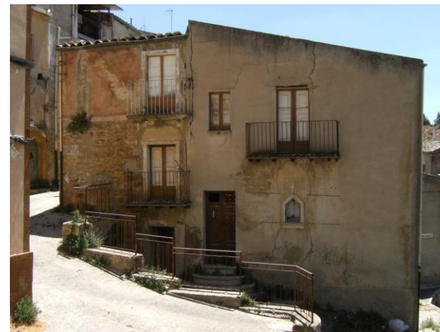
Foto n.4: Località Quartiere Itria (codice dissesto 077-4PA-051), fabbricato fessurato e sgombrato in via Golino n.10