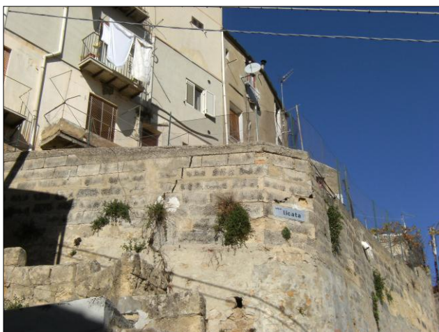
Foto n.13: Località Quartiere Itria (codice dissesto 077-4PA-051), lesione muro in pietrame a valle edificio multipiano angolo via Licata di cui alla foto n.7