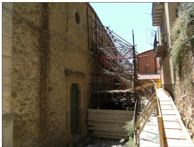
Foto n.2: Località Quartiere Itria (codice dissesto 077-4PA-051), particolare del paramento murario crollato lato ovest