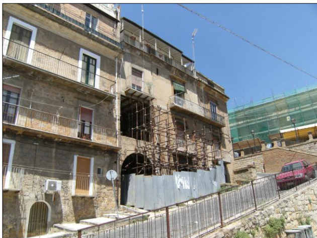
Foto n.3: Località Quartiere Itria (codice dissesto 077-4PA-051), stabile lesionato con sopraelevazione in via Itria