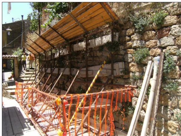
Foto n.12: Località Quartiere Itria (codice dissesto 077-4PA-051), particolare dei muri in pietrame spanciati e puntellati che contengono i terrazzamenti della zona di monte del versante