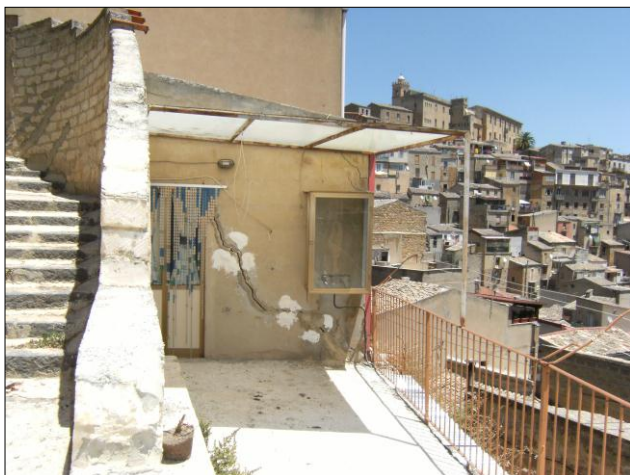
Foto n.11: Località Quartiere Itria (codice dissesto 077-4PA-051), fabbricato nel Cortile Arena con fratture vistose metriche e beanti.