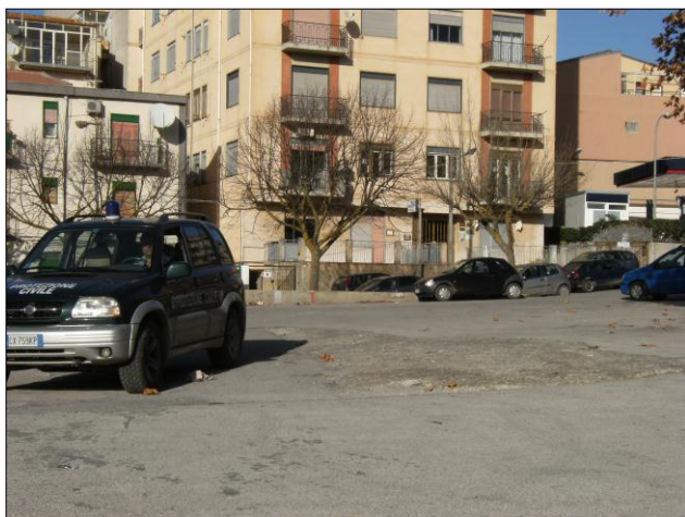
Foto n.15: area delle pendici di via Mazzini (codice dissesto 077-4PA-061), particolare dello sprofondamento della sede stradale - piazzale zona via Mazzini